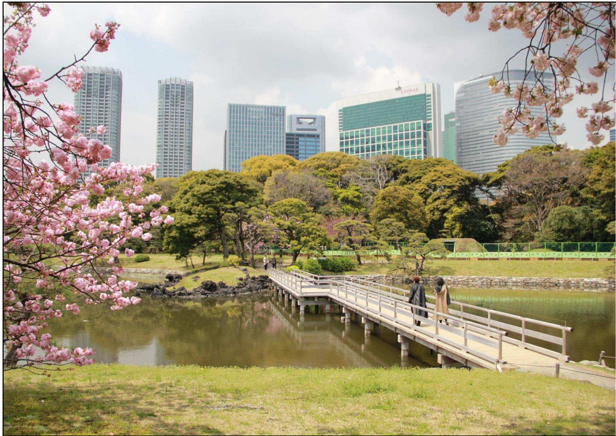
Den kejserliga Kyū Shiba Rikyū-trädgården i Tokyo

En bra park är en park som används. Lite tillspetsat kan man säga att det viktigaste i en stadspark är människorna som vistas i den. Stockholm har unikt många parker som inte används, eftersom traditionen under hela efterkrigstiden har varit att upphöja överbliven och ofta oländig spillmark till ex längs motorvägar till parkstatus. Därför är det välkommet att programförslaget öppnar för upprustning och kvalitetshöjning av de många "spillmarksparker" som finns, mot att delar av dem bebyggs. De populäraste parkerna, både i Stockholm och internationellt, är anlagda parker som Vasaparken, Hyde Park eller Central Park, som alla omgärdas av tät bebyggelse, vilket inte bara garanterar folkliv och närhet till serveringar utan även ökar trygghetsfaktorn.