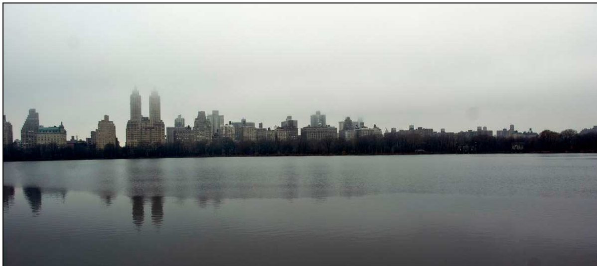
Central Park är det kanske det mest kända exemplet på en stor och populär stadspark omgiven av bebyggelse