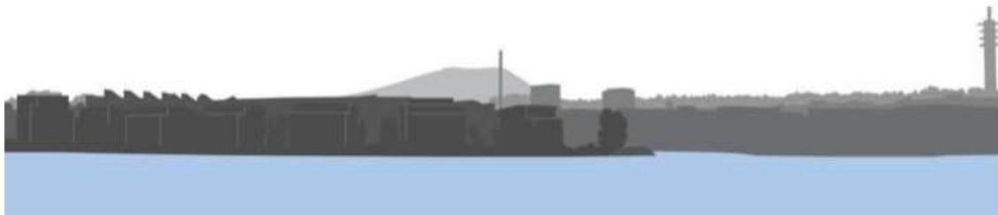
(Bild ur planbeskrivningen)

Vi ställer oss starkt frågande till Stadsmuseets kritik mot toppstugan och menar att det är en minst sagt märklig inställning att vilja bevara siluetten av en konstgjord höjd som började byggas på 1980-talet av fyllnadsmassor från Globen och Hammarby Sjöstad. Vi ser inga problem med att byggnaden får synas utan ser snarare gärna att byggnaden får ta lite mer plats än i förslaget genom en vassare arkitektur än den föreslagna. Ett tillskott till den sydöstra skyline som motverkar dess industriella karaktär skulle vara välkommet.